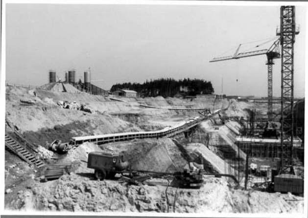
Gesamtansicht mit Betonförderband

Wasser- und Schifffahrtsverwaltung des Bundes