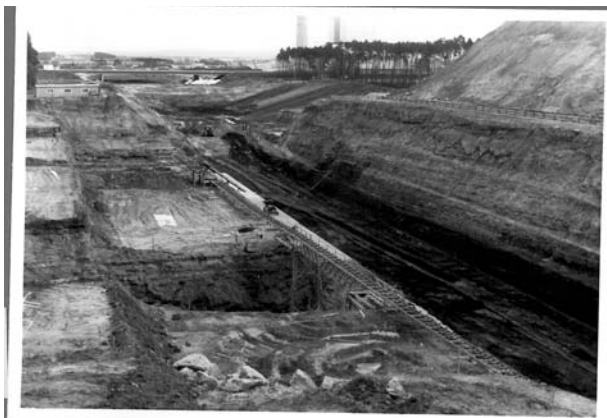
Aushub Schleusenammer 1968